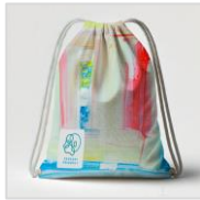
センサリーフレンドリーバッグ