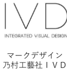
マークデザイン 乃村工藝社 IVD